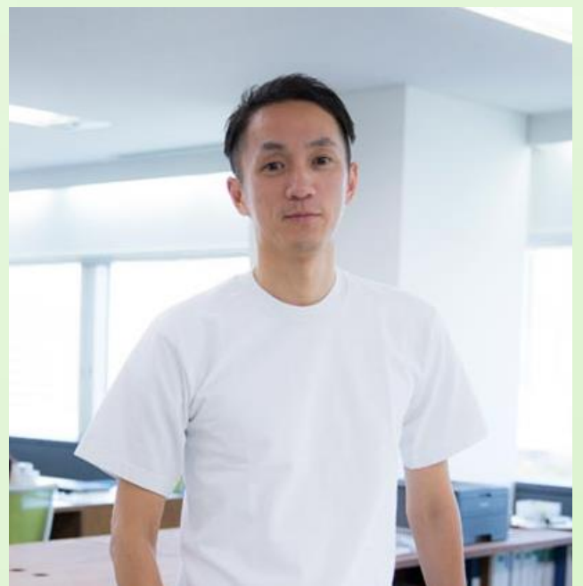
ナイチンゲール Florence Nightingale